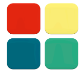
Kleurenstickers voor clip Art.nr. 660579