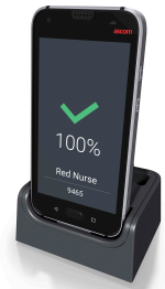
Opladstation (inclusief enkele batterijoplader) Art.nr. DC5-AAAB