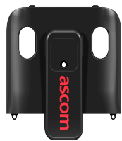
Achterkant, met clip Art.nr. 660585