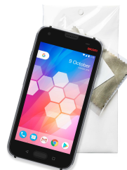
Schermbeschermingsset Art.nr. 660589 (Excl. Ascom Myco 3)

Wellicht zijn niet alle vermelde accessoires verkrijgbaar in uw land of regio. Neem voor meer informatie contact op met de Ascom-vertegenwoordiger bij u in de buurt.