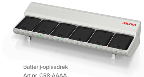
Batterij-oplaadrek Art.nr. CR8-AAAA