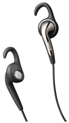
Headset, microfoon op kabel 3,5 mm Art.nr. 660516