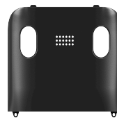
Achterkant, zonder clip Art.nr. 660580