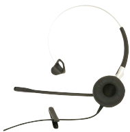
Headset 'microfoon op arm' QD, BIZ 2400 II Art.nr. 660508