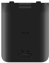
Batterijpakket Art.nr. 660578