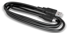
Micro USB-kabel Art.nr. 660586