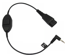
Headsetadapter met QD 3,5 mm Art.nr. 660515