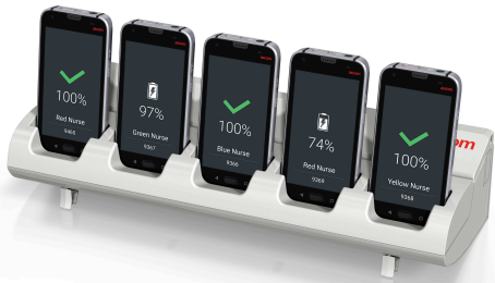
Handset-oplaadrek Art.nr. CR7-AAAA