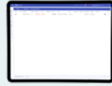
Nykyisten hälytysten luettelonäkymä