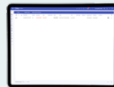
Listevisning av aktuelle alarmer