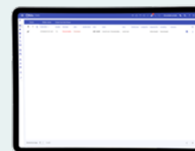
Liste des alarmes en cours