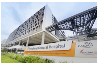
L'hôpital de Sengkang à Singapour