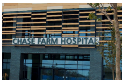
L'hôpital de Chase Farm à Londres