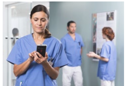
Donne aux médecins la possibilité d'accéder et d'échanger les résultats de laboratoires, les images, les demandes et les alertes alors qu'ils sont en déplacement.