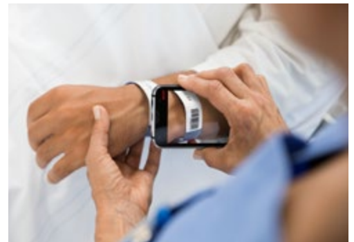
Lecture de codes-barres : vérification sécurisée de l'identité des patients pour l'administration de médicaments.