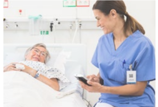
Enregistrement des constantes vitales dans le DPI directement depuis le chevet du patient.

La solution Ascom Myco 3 met à votre disposition un large éventail d'informations cliniques actualisées.